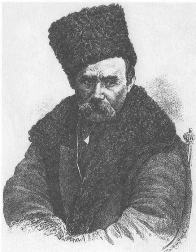
Taras Schewtschenko (1814–1861) Ukrainischer Dichter